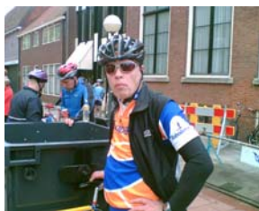
Ergens bij een controlepost

Om 06.10 uur “geht es los” om in wielertermen te spreken. De weersvoorzichten, althans volgens P.P. de weerman uit het noorden, waren voor de Pinksteren goed. Zonnige perioden en een temperatuur van een graad of 16. Maar het was koud, en er waaide een zeer sterke noordwestelijke wind. Aan het begin van de middag was er nog even hoop dat de zon nog door zou breken, maar later was deze weer snel verdwenen en zakte de temperatuur tot een waarde, waarop veel deelnemers niet bleken te zijn voorbereid qua kleding. Ook de zeer sterke wind brak veel deelnemers op. Totaal iets meer dan 1000 uitvallers.