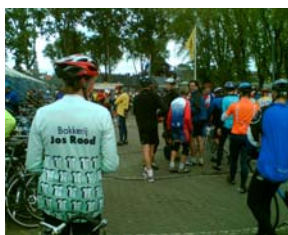
De finish na 240km

rekening houdend met de krachtsinspanningen die nog zouden komen.