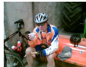
De koffie smaakt prima

De eerste 108 km, werd gefietst met voornamelijk wind van voren, zijwind en een windje schuin-achter. Daarna van Leeuwarden via Bolsward tot IJlst ca 50km de wind voornamelijk achter. Op dit stuk werd behoorlijk hard gefietst, en het was ook het stuk waarop veel deelnemers, omdat het zo lekker liep, veel krachten verspeeld hebben. Ook wij hebben hier behoorlijk hard gefietst, maar wel